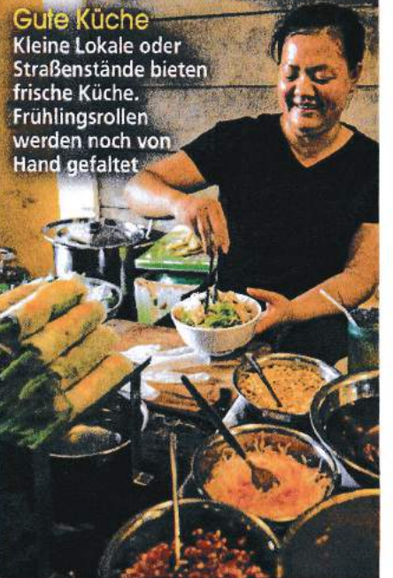
Gute Küche Kleine Lokale oder Straßenstände bieten frische Küche. Frühlingssrollen werden noch von Hand gefaltet

Mehr Vietnam-Infos: www.land-vietnam.de www.vietnam-travel-info.de