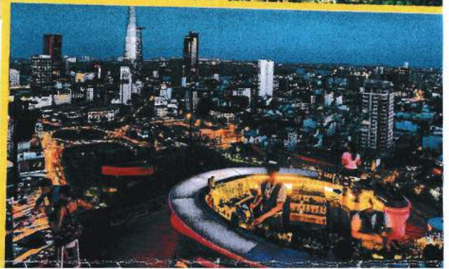
Spektakuläre Aussicht Von der Dach-Bar des AB Tower in Ho-Chi-Minh-Stadt (Saigon) blickt man über das Häusermeer von Vietnams Wirtschaftszentrum

Völlig relaxt werden Sie dann Ho-Chi-Minh-Stadt (Saigon), die letzte Etappe vor den Heimflug, ansteuern. Auf einem Spaziergang vom quirligen Binh-Tay-Markt zum An-Dong-Markt im Cholon-Viertel kommen Sie an der Jadekaiser-Pagode vorbei. Kantonesen erbauten die bunte, mit vielen Statuen und Schnitzereien verzierte Anlage 1909 zu Ehren von taoistischen, konfuzianischen und buddhistischen Gottheiten. Da ist er ja wieder: der ganze Zauber Südasiens!