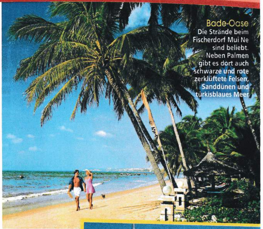
Bade-Oase Die Strände beim Fischerdorf Mui Ne sind beliebt. Neben Palmen gibt es dort auch schwarze und rote zerklüftete Felsen, Sanddünen und türkisblaues Meer