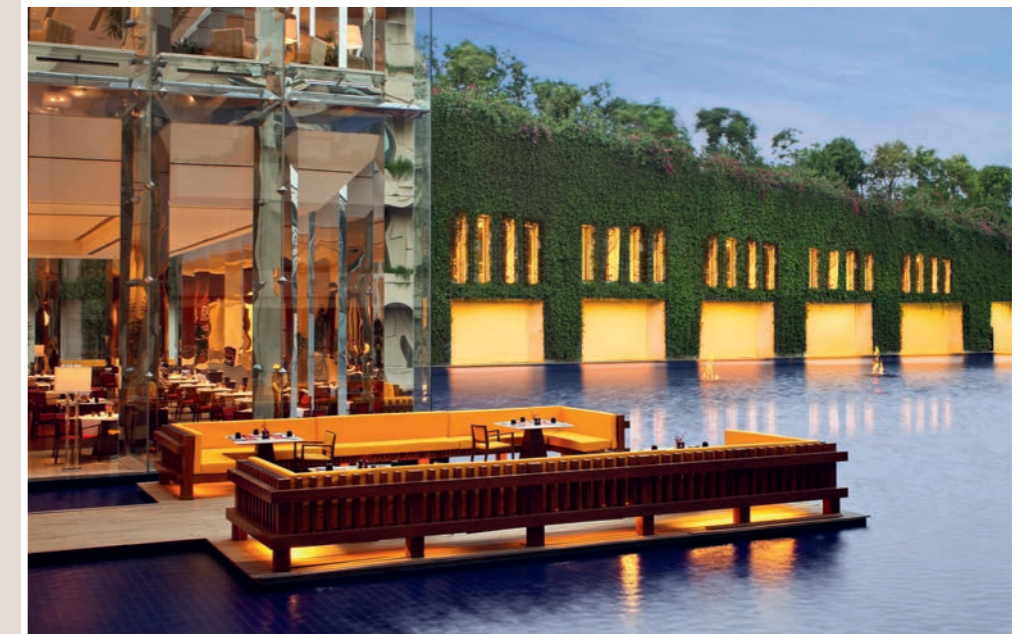
Contact The Oberoi Gurgaon | Delhi, India | www.oberoihotels.com