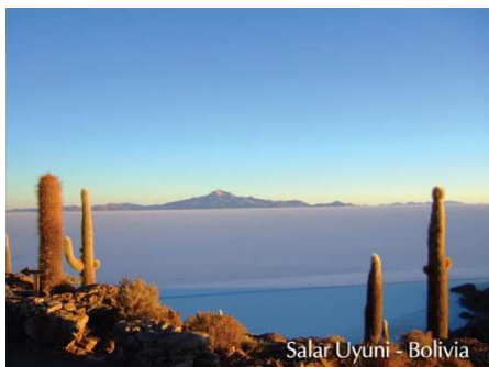
Salar Uyuni - Bolivia

Der „Salar de Uyuni“ ist der größte Salzsee der Welt und ist eine bekannte Touristenattraktion. Trotzdem ist dem Ort seine wilde, natürliche Ausstrahlung geblieben. In der Trockenzeit (März-Oktober) können einzelne Inseln besucht werden, wie zum Beispiel Incahuasi, auf der tausendjährige Kakteen zu sehen sind. In der Regenzeit (November-März) spiegelt die Wasserschicht auf der Salzfläche den Himmel und erweckt den Eindruck eines riesigen Spiegels. Eine außergewöhnliche Möglichkeit der Unterbringung ist das Luna Salada – ein Hotel, das