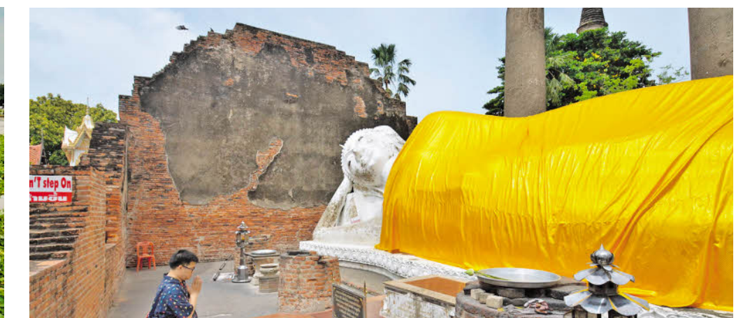
Im Gebet versunken bei einem der legenden Buddhas in Ayutthaya.