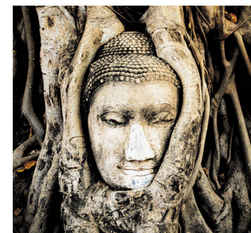
Fotomodell: Buddhas Kopf.

So wie Yul Brynner, Rex Harrison, Deborah Kerr oder Jodie Foster auf der Leinwand und im TV versuchen Europa und Thailand seit Jahrhunderten, einander besser zu verstehen. Thailand war jedoch nie Kolonie, sondern stets selbstständig. Vielleicht bleibt deshalb immer ein Zauber des Fremden, Exotischen und Mystischen bestehen.