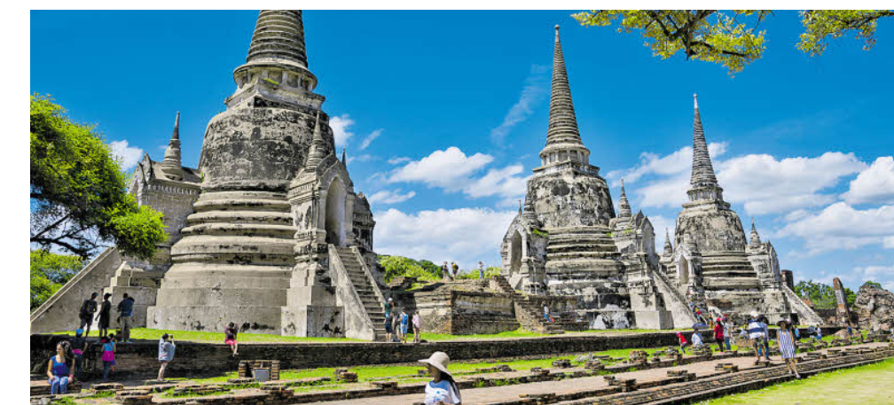
Begehrte Nachbauten: Chedis im Geschichtspark von Ayutthaya.